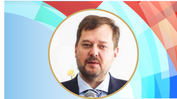
Евгений Балицкий, глава Запорожской области

Опыт Херсонской области берут на вооружение другие СМО новых регионов. В 2024 году они нацелены на тесное взаимодействие с муниципальным сообществом России.