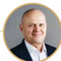
Владислав Логинов, глава города Красноярск

Мы строим все планы во взаимодействии с жителями, благодаря их участию мы вовремя вносим корректировки в нашу работу. Сейчас на первое место выходит марафон «Муниципальный диалог», инициированный Всероссийской ассоциацией развития местного самоуправления. На сегодняшний день это и социальные сети, и «прямые линии», которые мы проводим с жителями на регулярной основе. Без прямой связи с людьми нельзя понять, что реально происходит. Эффективность взаимодействия дает высокий результат.