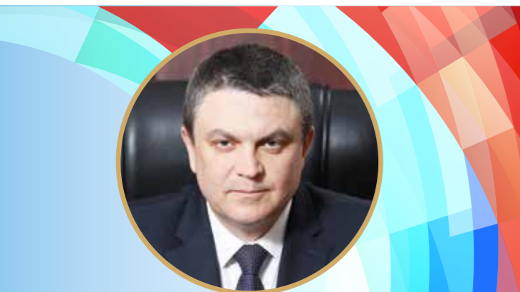
Леонид Пасечник, глава Луганской Народной Республики

Такая организация нам действительно необходима, чтобы работа органов местного самоуправления была максимально слаженной, плодотворной и комфортной. Важно и то, что СМО станет площадкой, где будут обсуждаться актуальные вопросы местного самоуправления, которые волнуют всех жителей Республики.