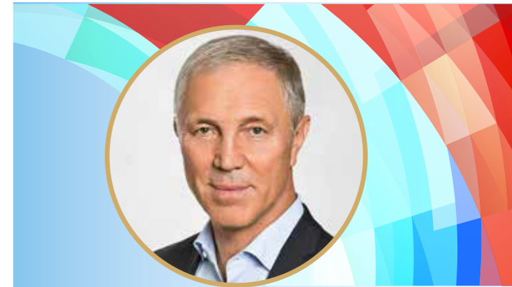
Владимир Сальдо, глава Херсонской области

Создание Совета муниципальных образований Запорожской области очень своевременно. Он призван усилить работу с обращениями жителей региона. Ни одно обращение наших граждан не должно оставаться без ответа, нужно вникать во все проблемные вопросы, быть в постоянной коммуникации с людьми.