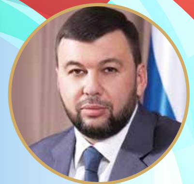
Денис Пушилин, глава Донецкой Народной Республики

Так, в декабре 2023 года Совет муниципальных образований Херсонщины подписал первое соглашение о сотрудничестве с Кубанью. Напомним, Краснодарский край является регионом-шефом Херсонской области, оказывает ей помощь в становлении и развитии. В рамках достигнутых договоренностей Кубань будет оказывать консультации и содействие Херсонской области в реализации инициативного бюджетирования, привлечении некоммерческих организаций к развитию территорий, разработке и внедрении муниципальных нормативных правовых актов. В рамках подписанного соглашения 6 декабря