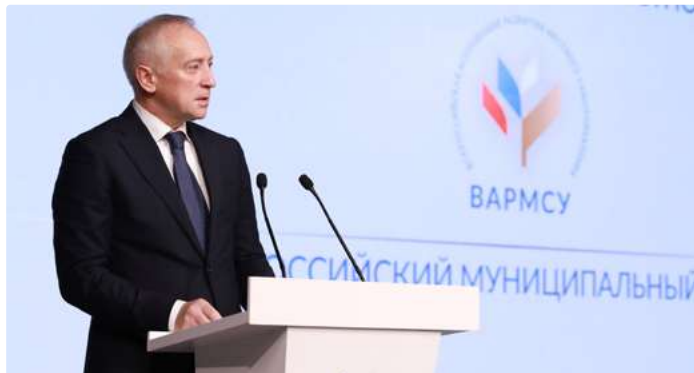
Выступление заместителя начальника Управления Президента Российской Федерации по внутренней политике Владимира МАЗУРА .

«Сегодня мы проходим важный этап развития российской государственности – формируем единую систему публичной власти. Местное самоуправление – это основа, фундамент этой системы. Глава каждого муниципалитета, от мегаполиса до небольшого поселения, должен четко осознавать общий вектор государственных задач и работать совместно с региональными властями над реализацией поставленных Президентом Российской Федерации национальных целей развития. Сейчас мы живем в эпоху беспрецедентного давления на нашу Родину со стороны недружественных стран. В это непростое время как никогда важно сохранять самообладание и демонстрировать подлинное единение российского народа. Вызовы и угрозы, с которыми Россия столкнулась лицом к лицу, требуют от нас в кратчайшие сроки минимизировать негативный эффект от так называемых «санкций» со стороны коллективного запада. Уверен, что в рамках форума вы сможете выработать конкретные решения, направленные на повышение устойчивости муниципальной экономики», – говорится в приветственном адресе.